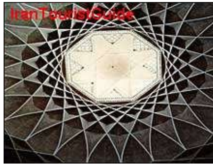
شکل ۱-۲ یک اثر معماری

گاه برای نشان دادن یک دستگاه، شیء یا رویداد، تنها از عکس می‌توان کمک گرفت. هرگاه جزء خاصی از عکس مورد نظر است، باید به‌گونه‌ای تهیه شود که اجزای فرعی چشمگیرتر از جزء مورد نظر نباشد (شکل ۱-۲).