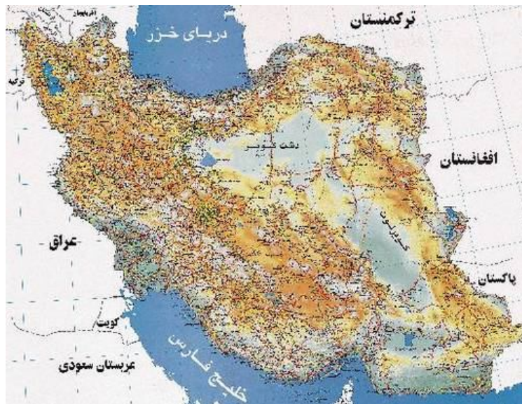
نقشه ۱-۲ نقشه ایران

باید تا حد امکان از به‌کاربردن صفحه‌های بزرگ مانند نقشه‌ها در پایان‌نامه خودداری شود و آنها را از طریق رونوشت‌های (فتوکپی‌های) مخصوص در اندازه تعیین شده تهیه کرد. در صورت لزوم باید به دقت صفحه مورد نظر را داخل پایان‌نامه طوری تا نمود که لبه آن از دیگر صفحه‌ها بیرون نزند.